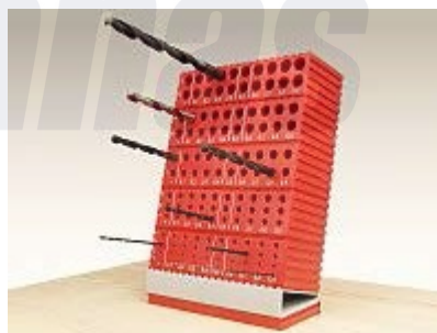
Pro sady vrtáků

V boxech pro vrtáky jsou průměry úložných dutin odstupňovány po 0,1mm a mají popisky. Popis urychluje nalezení potřebného vrtáku a odstupňování napomáhá ke správnému zařazení vrtáku zpět na patřičné místo.