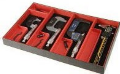
Speciální krabičky na měřidla

Zvláštní skupinu této výšece systému tvoří krabičky pro ukládání měřidel (především posuvných měřidel a mikrometrů). Společně s měřidlem je možné na stejné místo uložit i jeho příslušenství, psací potřeby, rýsovací jehlu a podobně.