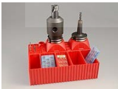
Kombinace s boxy

Jednotlivé krabičky je možno spojovat jako stavebnici pomocí rybinového drážkování do libovolných sestav. Mohou se kombinovat mezi sebou navzájem, ale i s boxy, panely a rozšiřujícími prvky.