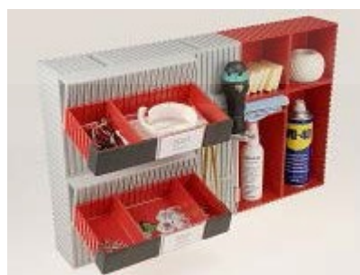
Kombinace s panely