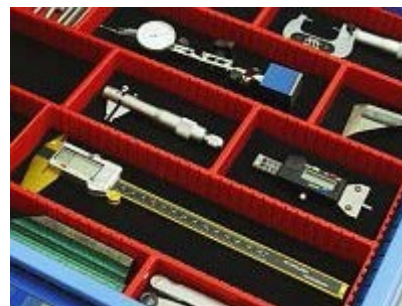
Klasické krabičky s výstelkami

Vyjímání nástrojů je velmi elegantní. Stačí palcem mírně zatlačit na stopku nástroje, čímž se jeho řezná část vyhoupne vzhůru a to umožní snadné uchopení do ruky.