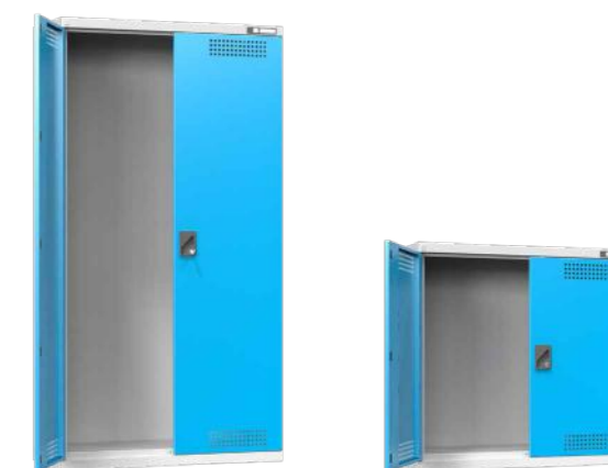
Šířka 1044 mm, hloubka 405 mm