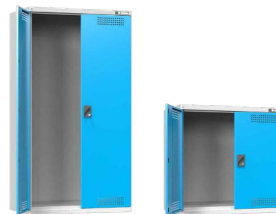
Šířka 1044 mm, hloubka 625 mm