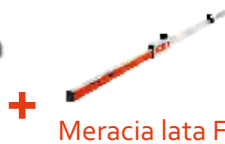
Meracia lata FL